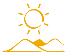
Oblasti sklone čestim sušama