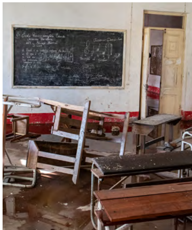
Save the Children/Save the Children

Realizatori programa i dizajneri fokusirani na migraciju i raseljavanje treba da: