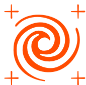
Zone ciklona, orkana i tajfuna