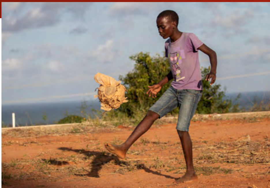
Sacha Myers/Save the Children